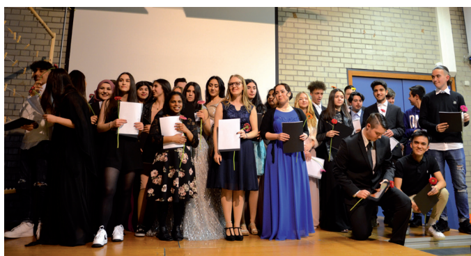
Abschlussfeier in der Mittelschule am Hummelsteiner Weg

Am 03. April 2019 fand in der Mittelschule am Hummelsteiner Weg die Abschlussfeier für die aus dem Projekt ausscheidenden Schülerinnen und Schüler der 9. Jahrgangsstufe statt. Alle am IBOS-Prozess Beteiligten waren voll Freude